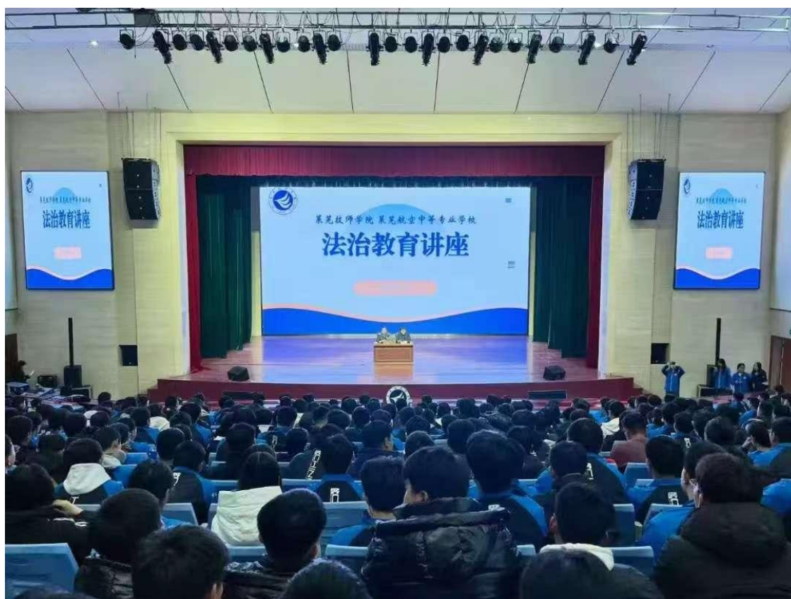
图 33 法制讲座现场

紧扣学生的年龄与心理特点，围绕“预防未成年人违法犯罪”“防范校园欺凌”“警惕网络诈骗与网贷”等主题，结合发生在青少年身边的真实案例，展开深入浅出的讲解。“什么样的行为构成校园欺凌？”“遇到‘校园贷’陷阱该怎么办？”“出于义气帮人办张电话卡，为什么会涉嫌犯罪？”——这些贴近学生实际的问题，在法律讲座活动中给出正确答案。学校将法治讲座设置成“法治必修课”，把青少年忽视、没什么大不了、没事等对事物的态度，在同学们中引起共鸣，不仅提升了学生明辨是非、自我保护的能力，也为构建和谐、安全的校园环境注入了正能量。