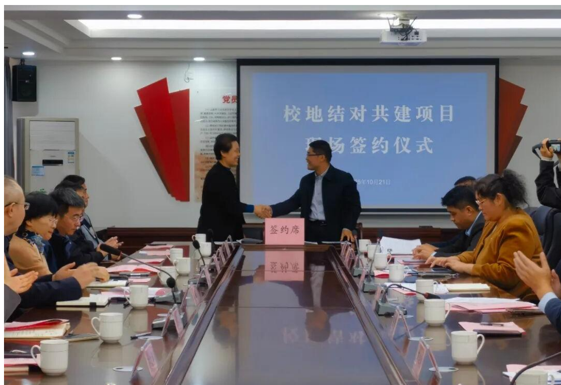
图 31 校地结对共建项目签约