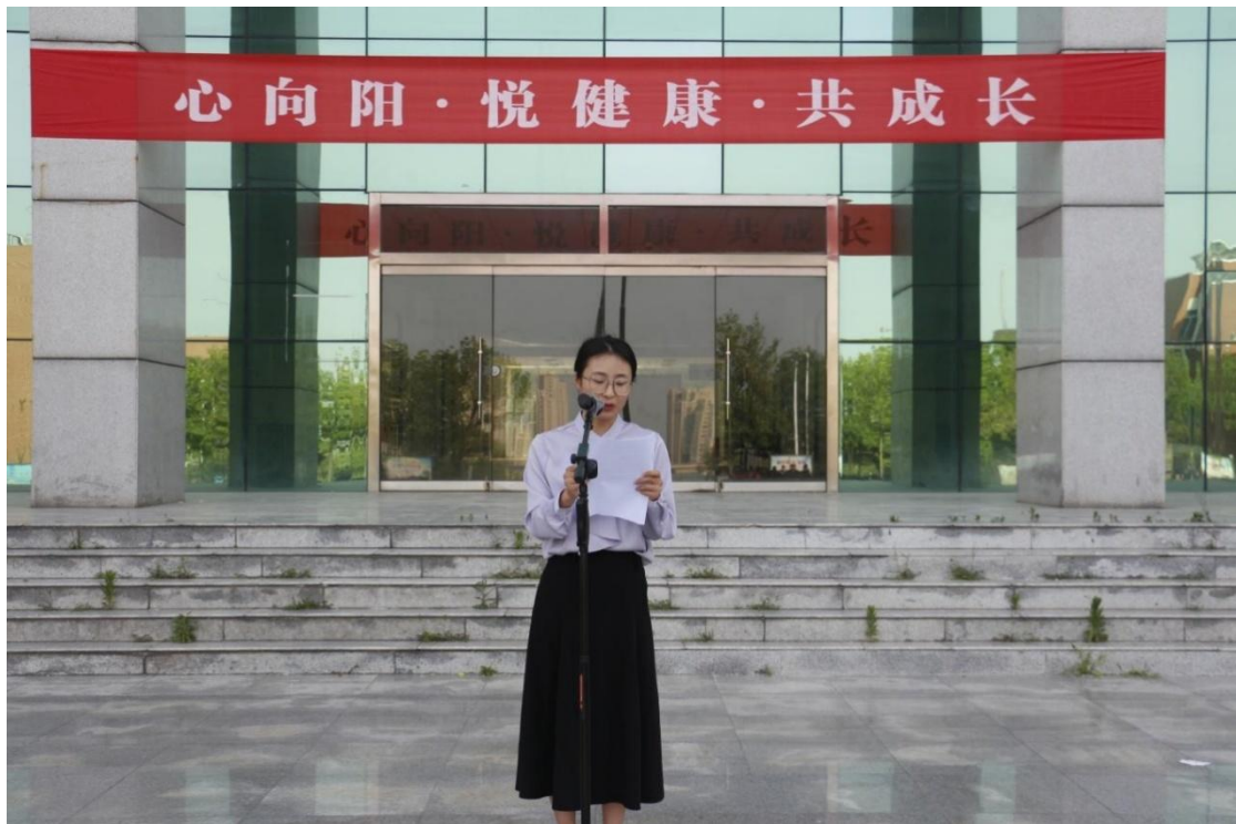
图6 心理健康教育主题活动