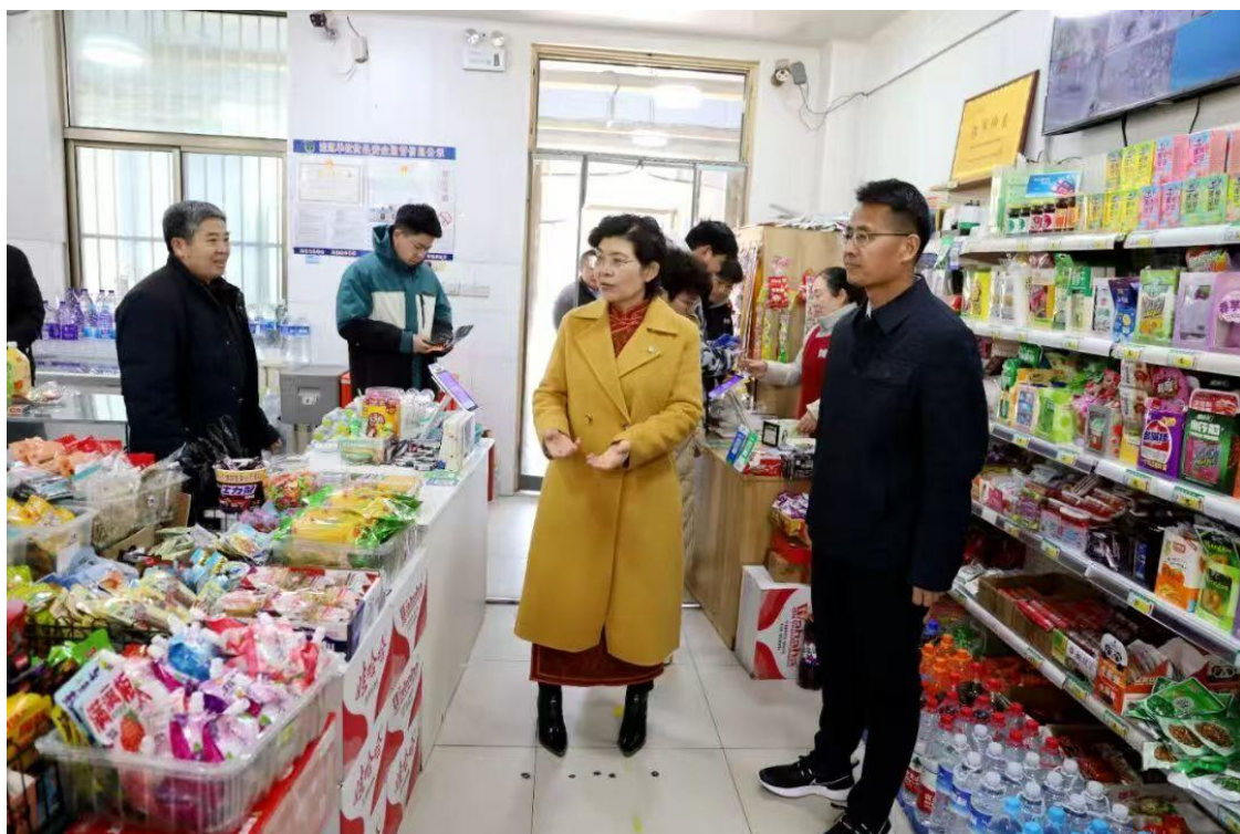
图 35 新学期食品安全检查