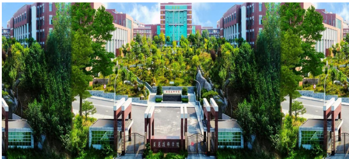
图 1 校园全貌

济南市莱芜航空中等专业学校是一所普通全日制中等专业学校。位于济南市莱芜高新技术开发区，隶属济南市教育局。与莱芜技师学院师资共享、资源配置共享。学校以向普通高等院校输送专业对口人才和培养适应经济社会发展需要的技术技能人才为导向，坚持学历教育和技能教育相结合，实现高标准升学、高质量就业。