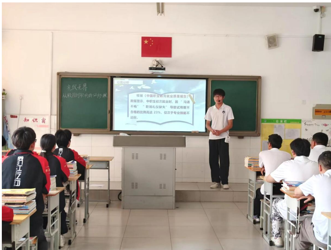
图 8 学生校园礼仪课堂展示