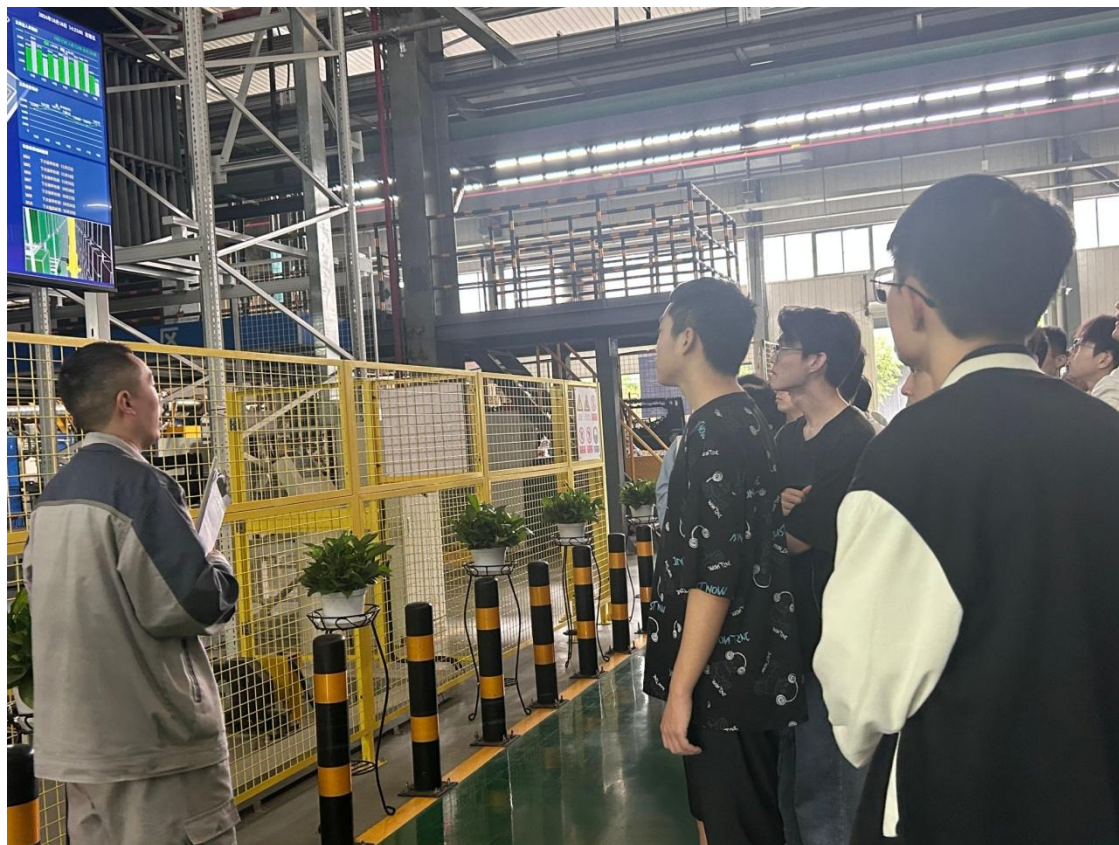
图 32 学生参加岗位实习

学校锚定国家战略需求和社会经济发展需要，以学生“高标准升学、高质量就业”为目标，围绕区域重点产业发展，优化专业设置，科学布局与区域主导产业、骨干产业、新兴产业培育相对应的“产业学校”，调整相配套的专业群，全面推行产教融合、校企合作的人才培养模式，实现了人才培养有目标，学生就业有方向。