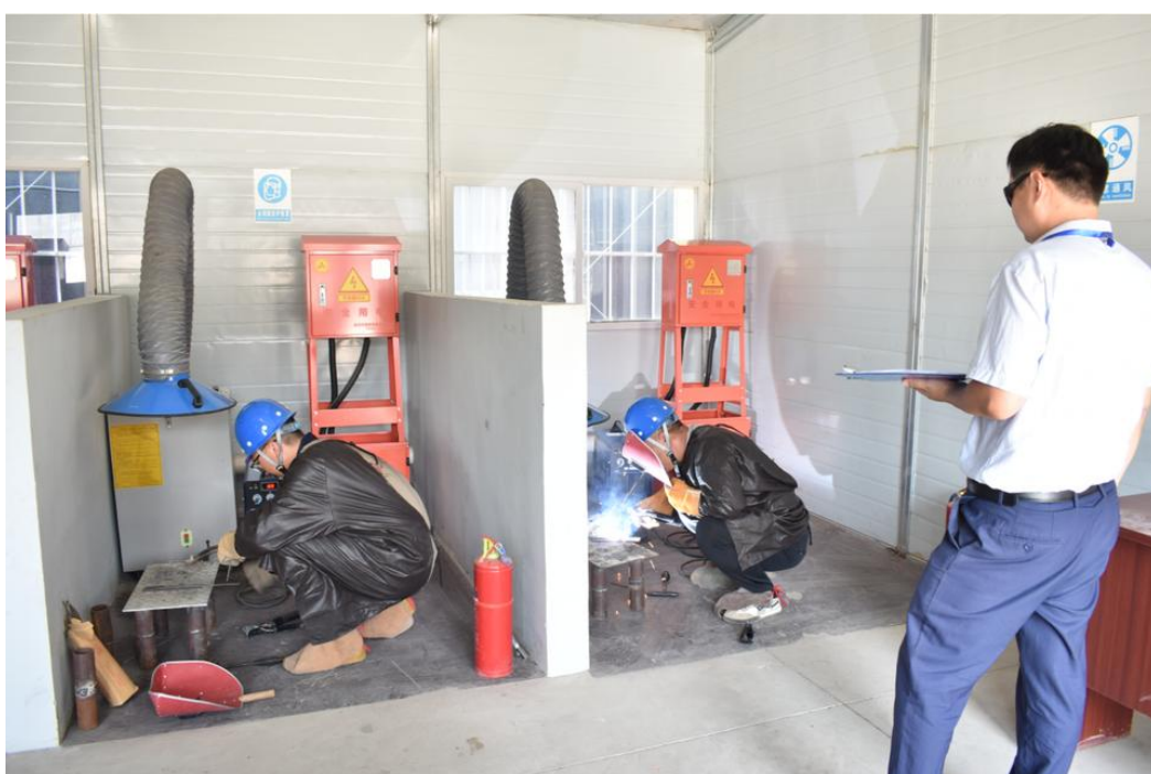
图 17 特殊作业证考试现场

三是提升教师的安全生产教学水平。目前学校专任教师中近一半为双师型教师，他们理论水平高、技能功底扎实。学校鼓励电工、电子、计算机、焊接等相关专业教师报名安全生产考试考评员。目前 71 名教师已取得相应考评工种的特种作业人员证，为做好安全生产教学奠定了坚实的师资基础。