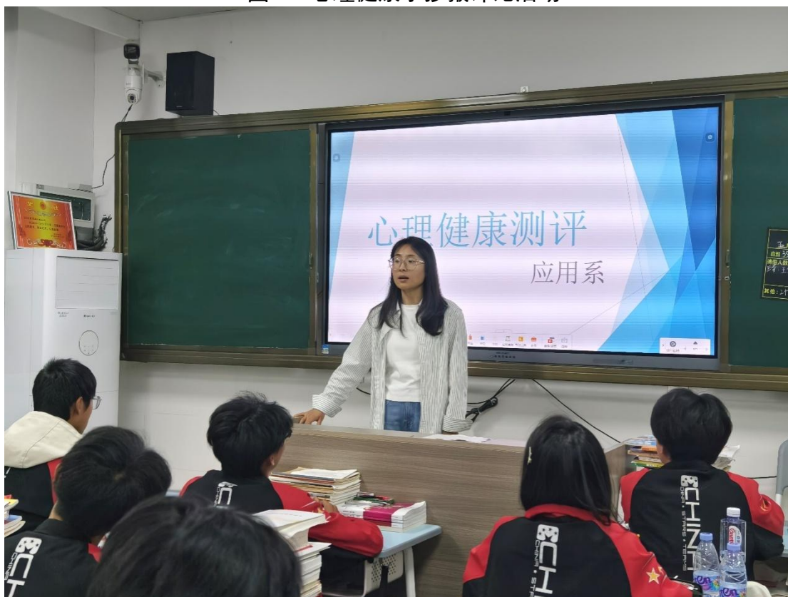
图 5 心理健康测评