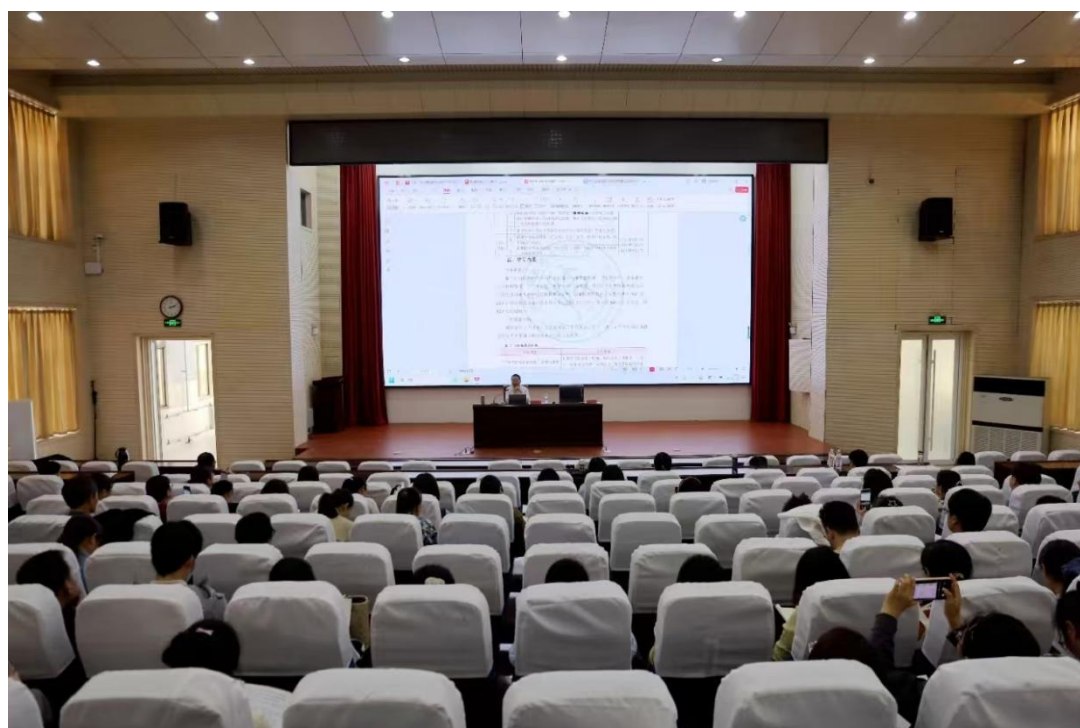
图 10 教学能力提升培训

学校制定教师素质提升、名师培养工程和学科带头人制度，实施名师带动战略。构建教师自己的学科知识体系，夯实其教学基本功，促进专业课教师向一体化教师方向发展，一体化教师向规范性、创新性、引领性方向发展。适时开展教学能力提升培训，加大教学研究力度，引导教师明确教研与教改、教学的关系，提高自身科研水平和管理水平。