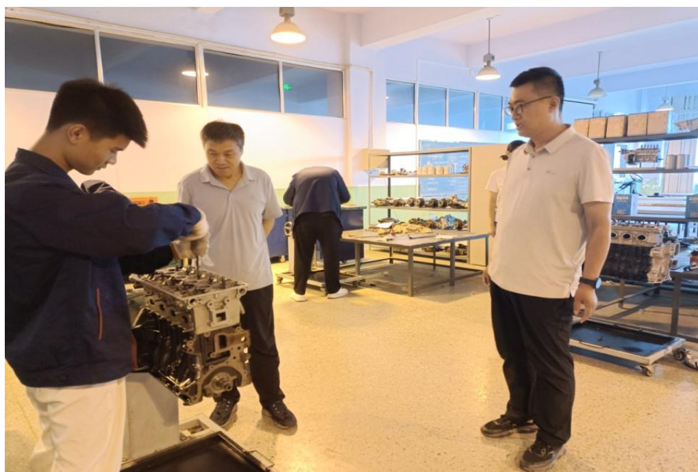
图 7 汽车运用与维修专业学生参加市级抽测

业的 450 名学生开展校级专业技能抽测工作。组织机电技术应用、会计事务、数控技术应用、汽车运用与维修等四个专业 73 名学生开展了市级专业技能抽测工作，抽测成绩优秀，有效检测学生专业技能和专业知识的学习成效，提高人才培养质量。