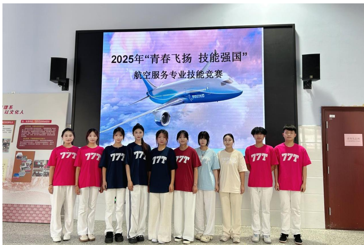
图 13 航空礼仪竞赛项目场