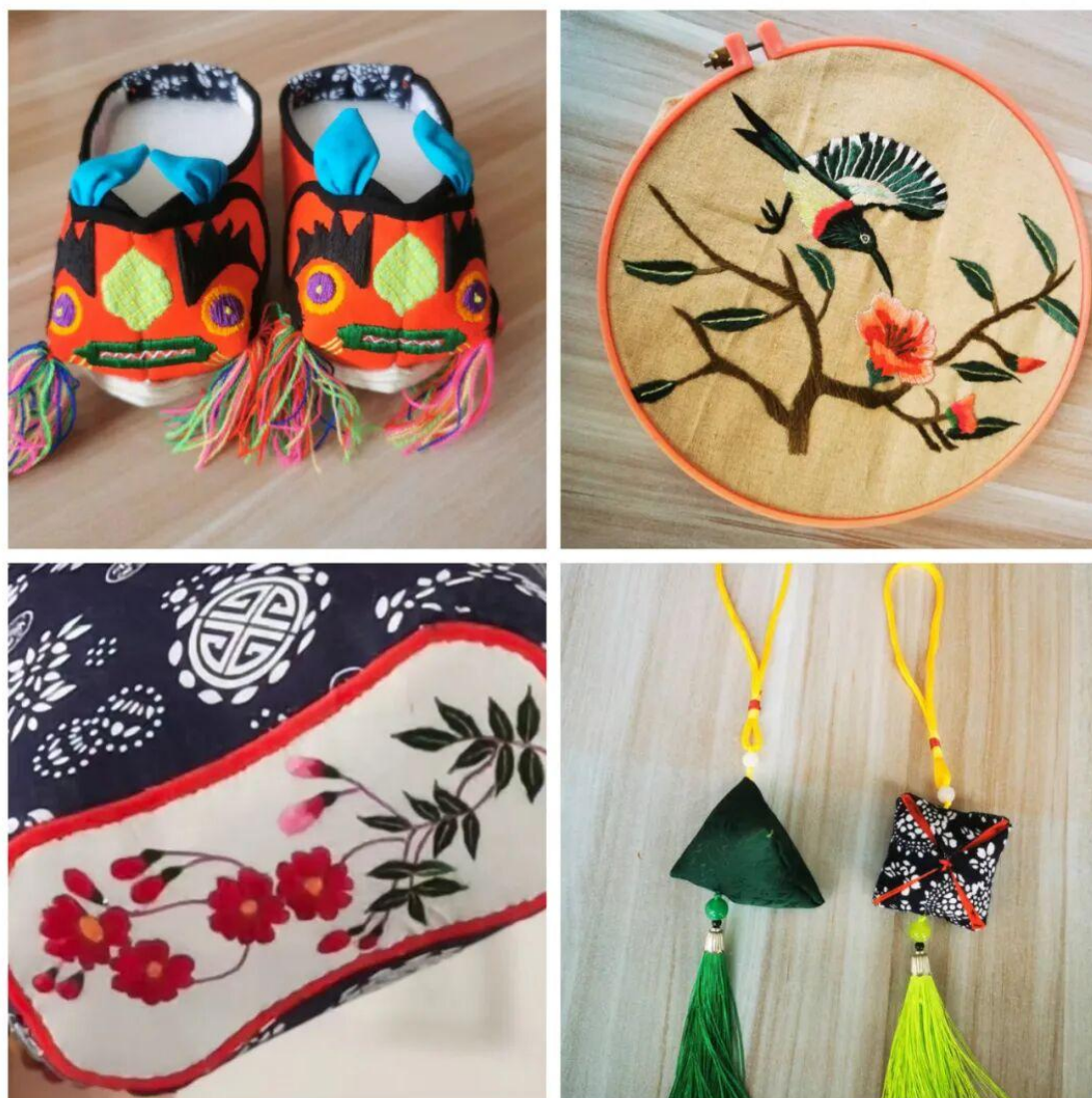
图 24 非遗课堂成果展示

的新生力量，实现了“育人”与“传承”的双重目标。下一步，学校将以此次刺绣课程为起点，进一步深化与政府、行业的合作，计划逐步引入锡雕、黄河泥陶塑等非遗项目，构建“多品类、系统化”的非遗课程体系；同时，还将探索“非遗+创新创业”模式，鼓励学生将传统技艺与现代设计、电商销售结合，让非遗作品“走出校园、走向市场”，助力传统工艺实现“传承与创新”的双向发展。