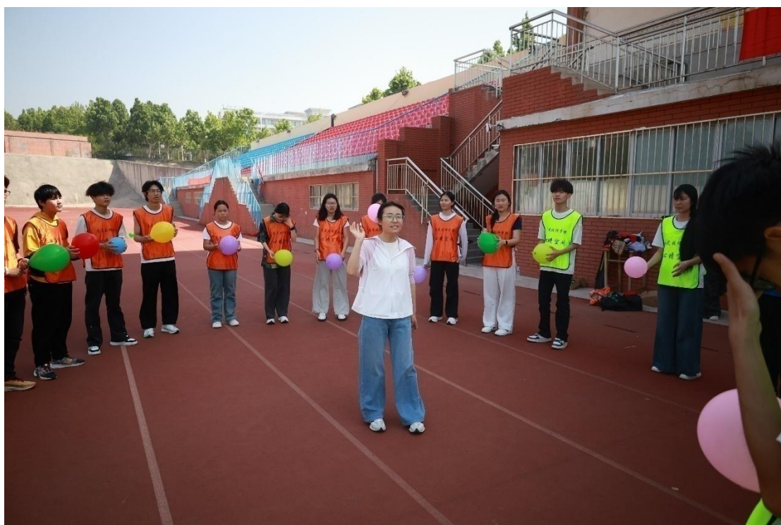
图9 形式多样的文体活动

良好师生关系。通过国旗下下的演讲、主题班会、读书活动、合唱比赛、作品展示诵读活动、文艺汇演等一系列形式多样的文体活动，强化了学生感恩教育、习惯教育、养成教育，营造了昂扬向上、团结奋进的良好氛围。2024-2025 学年，学校综合问卷调查情况，学生对校园文化与社团活动满意度、生活满意度、校园安全满意度、毕业生对学校满意度均在 98%以上。