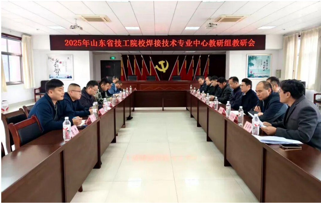
图 30 专业研讨会专家合影