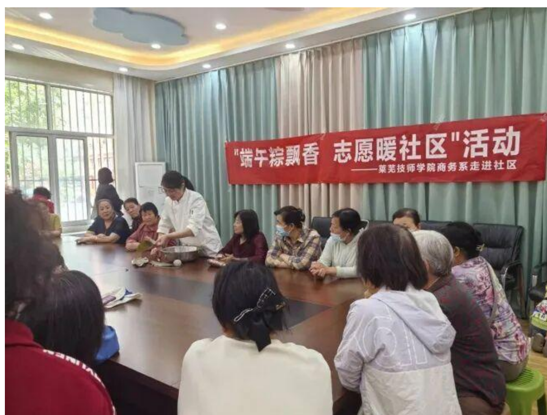
图 29 端午粽飘香活动现场

活动以“包粽”为纽带，实现了“党建+文化+服务”的三重深度，强化了党员的责任担当与服务意识，让社区居民感受到学校的温暖，让红色基因与技能匠心在服务社会中绽放光彩。