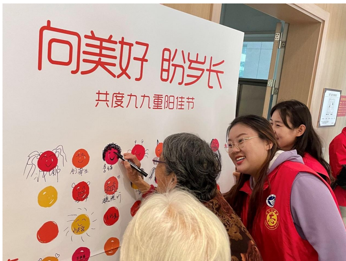
图 21 志愿者在重阳节志愿服务活动中与老人互动游戏