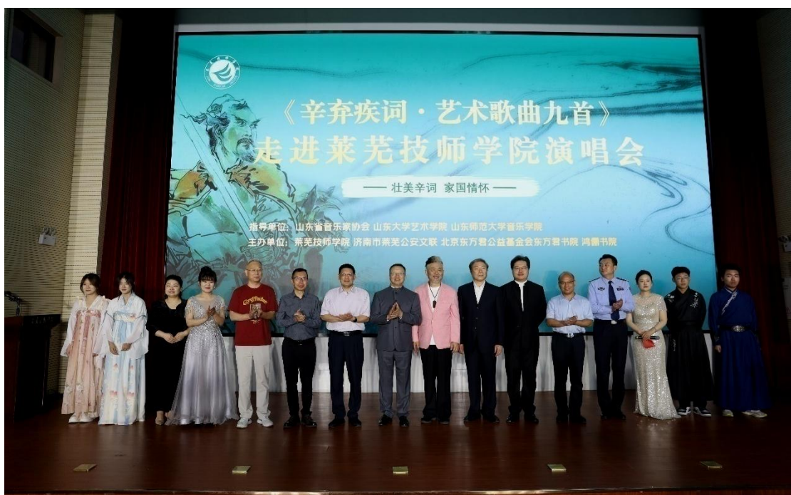
图3 举办“壮美辛词 家国情怀”辛弃疾词艺术歌曲演唱会