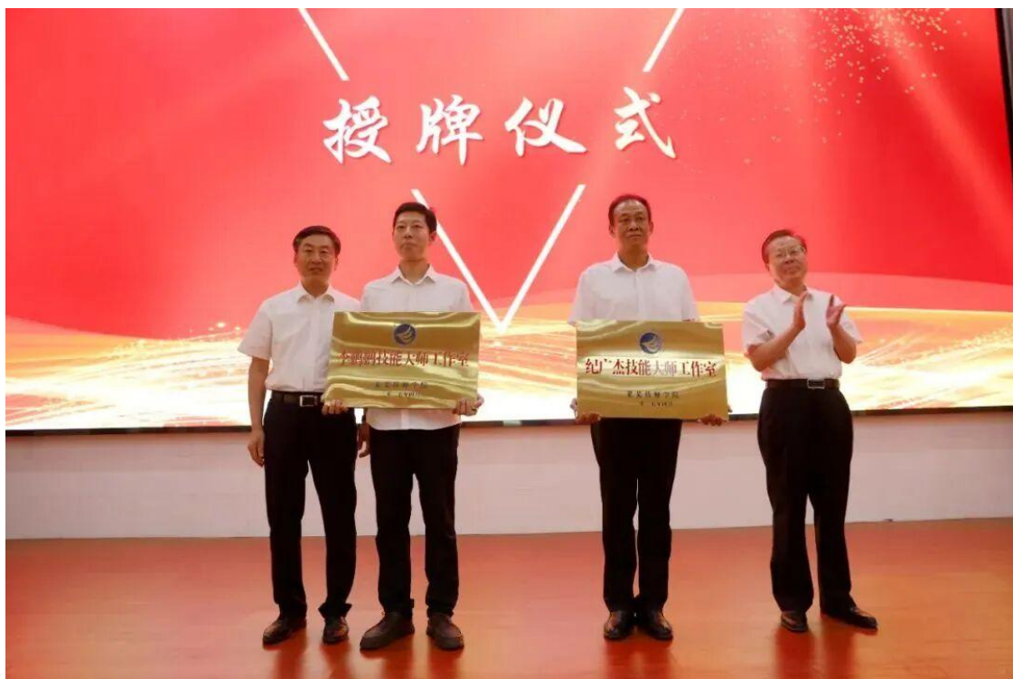
图 27 校级技能大师授牌

技能人才的培养需要政府引导、企业参与、学校主导的协同发力。“技能大师进校园”系列活动的成功实践，印证了“大师领航+阵地支撑+赛事驱动”模式在技能人才培养中的重要作用。未来，需进一步深化政企校合作，持续推动技能大师资源进校园、进课堂、进项目，完善技能竞赛体系，强化工匠精神培育，让更多青年学子通过技能成长实现人生价值，为制造业高质量发展、现代化强省会建设提供源源不断的人才保障