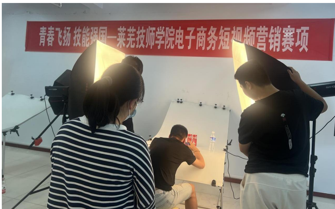
图 11 短视频拍摄项目竞赛现场