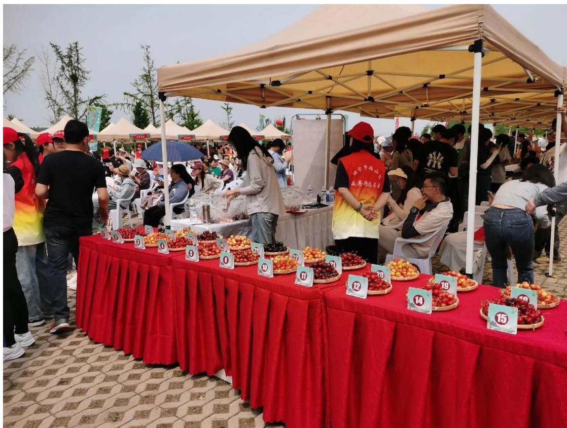
图 19 第十八届樱桃节学生社会实践活动