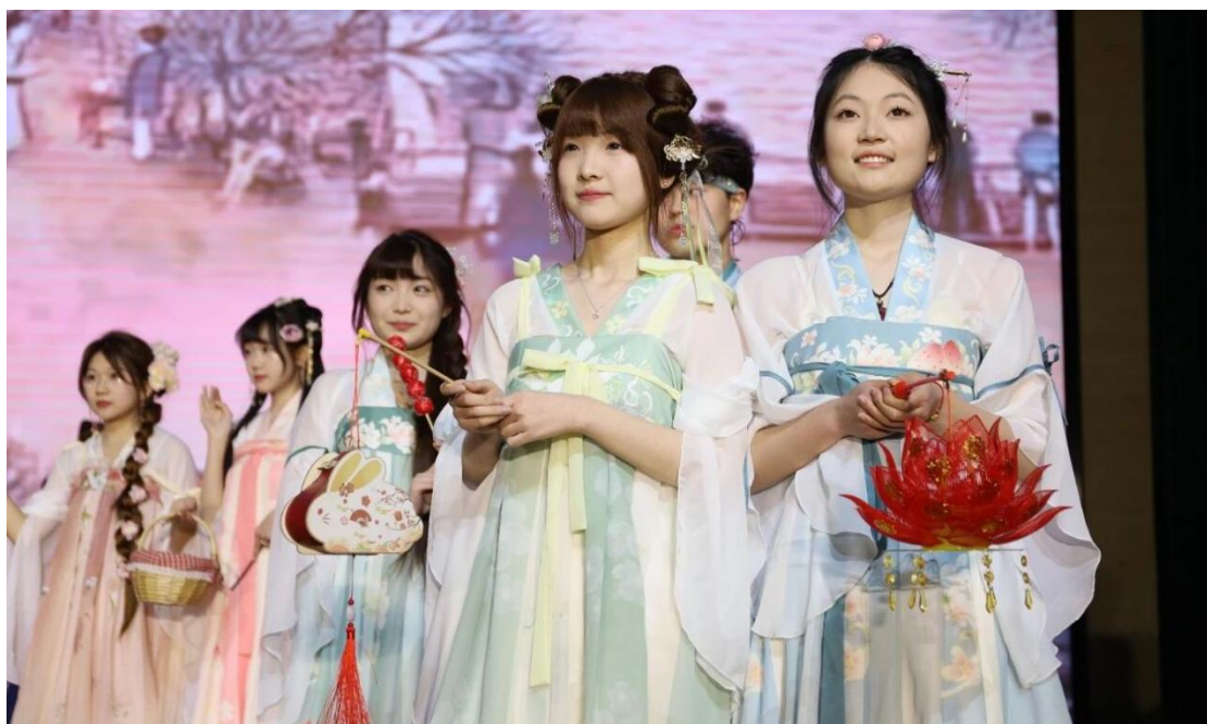
图2 “诗韵清明”经典诵读活动中学生进行传统文化展示