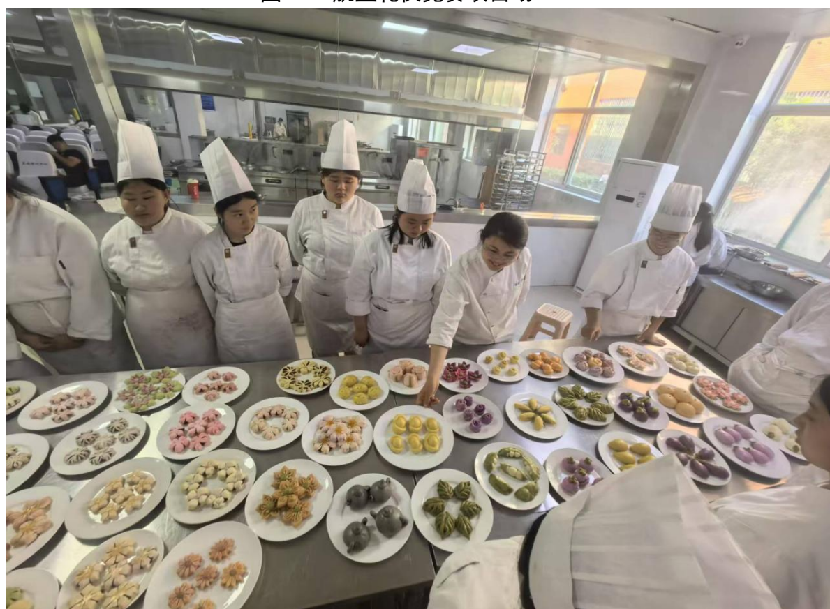
图 14 烹饪面点项目现场