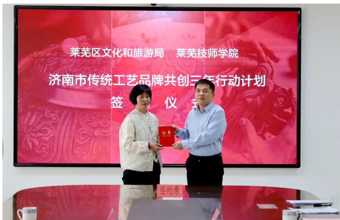
图 23 学校向非遗传承人颁发聘书

莱芜航空中等专业学校此次非遗刺绣课程的开展，并非“一次性活动”，而是“政校非遗协同育人”模式的“首次实践”。从签约共建到课程落地，从大师授课到实践创作，每一个环节都体现了“让非遗融入教育、让技艺传承下去”的理念。此次实践的意义，不仅在于让 30 余名师生学会了刺绣技艺，更在于通过“课程化”“场景化”的教学方式，让非遗技艺从“博物馆”走进“校园”，从“小众传承”走向“大众认知”，激发了师生对传统工艺的兴趣与热爱，为非遗传承培育了“潜在力量”。