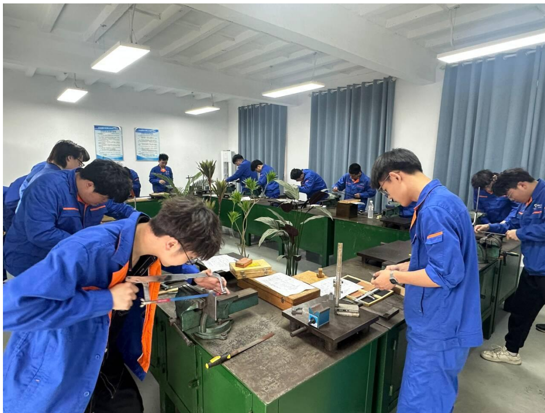
图 18 钳工技能认定考试