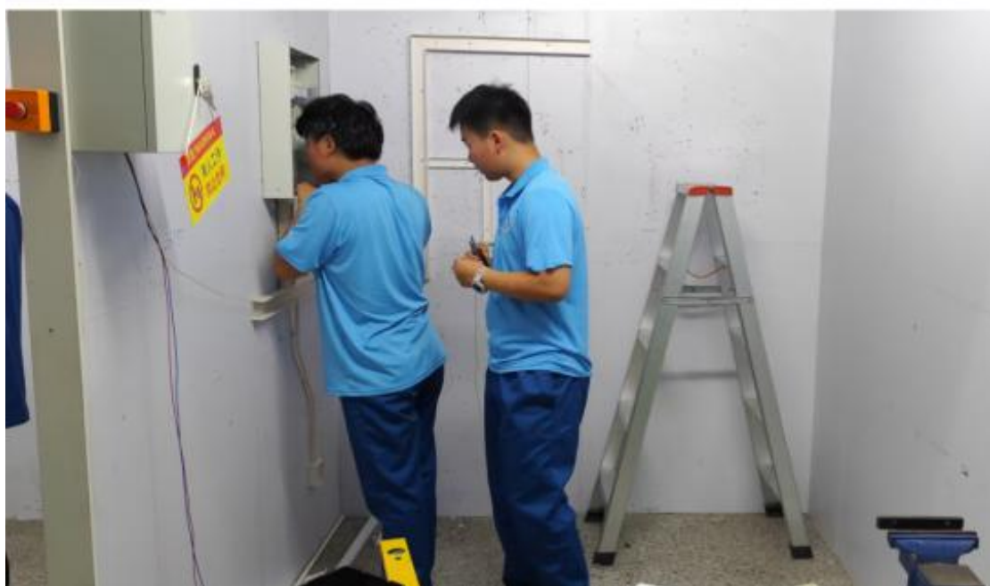
图 16 电气装置竞赛项目现场

此次竞赛活动覆盖全院各系，共设置了焊接加工、数控加工、汽车维修、工业机器人操控、电气装置、电子技术、舞蹈、烹饪、电子竞技、弟子规、CAD 制图等 57 个竞赛项目，参赛师生近 1300 余人。