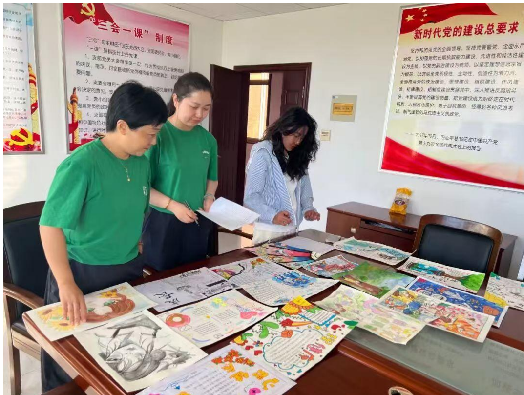
图 4 心理健康手抄报评比活动