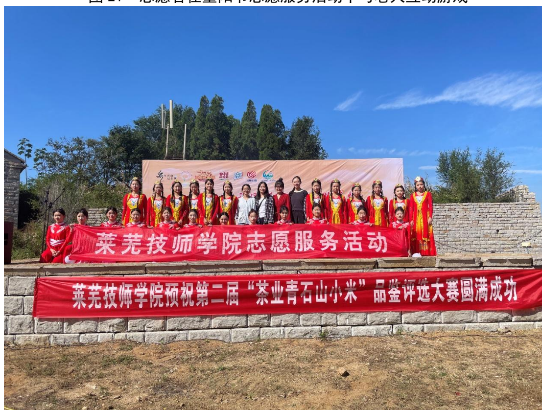
图 22 师生在茶业口镇开展茶业丰收季志愿服务活动