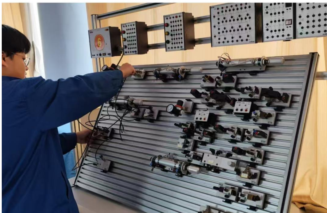
图 15 液压、气动竞赛项目现场