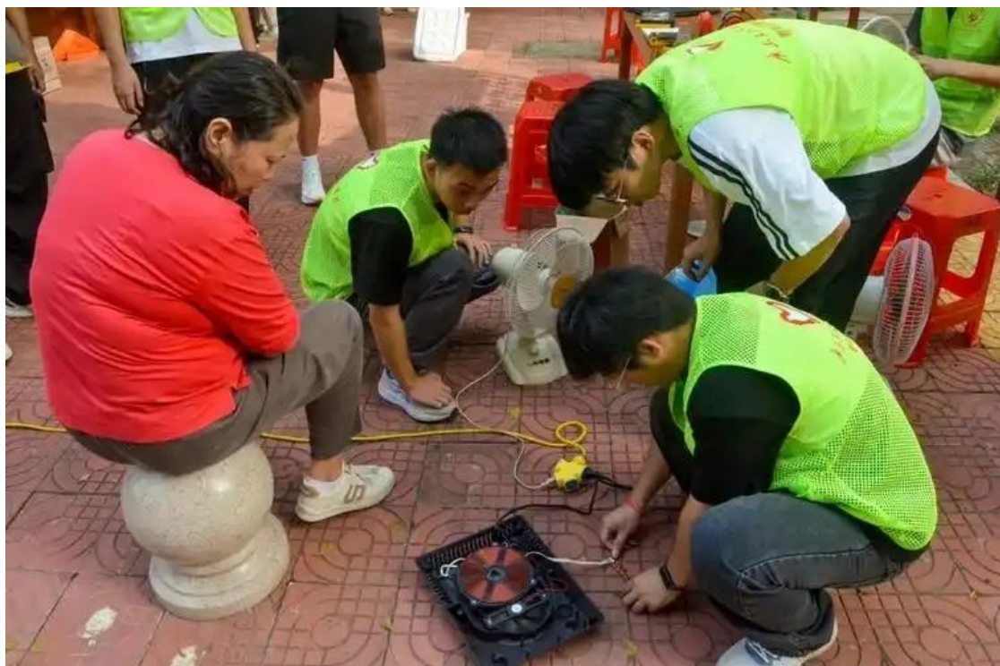
图 20 家电维修社区社会实践活动

以“学雷锋志愿服务月”为契机，组织师生走进公园、社区、图书馆、高铁站等场所开展垃圾清理、植树造林、秩序维护等志愿服务千余场次。创新“专业技能+志愿服务”模式，开展“技能服务美好生活”“花样面点培训”“小家电维修”等特色服务，助力乡村振兴、社区发展。学校多支志愿服务队常态化开展“科技下乡”“文化惠民”“关爱留守群体”等活动。深化“校地共建”，与珍珠花园社区、茶业口镇下王庄村、逯家岭村等建立合作关系，积极发挥学校专业特色，通过乡村文化旅游节演出、小家电维修、面点培训、文化墙绘制等技能服务，将专业学习与区域发展需求紧密结合，提升了学生的实践能力和社会责任感。开展中小学生学习劳动实践服务，每年接待中小学生学习3000余人次，助力区域教育发展。在实践育人过程中，多名团干部、学生获得省市级优秀学生、优秀学生干部等荣誉称号。