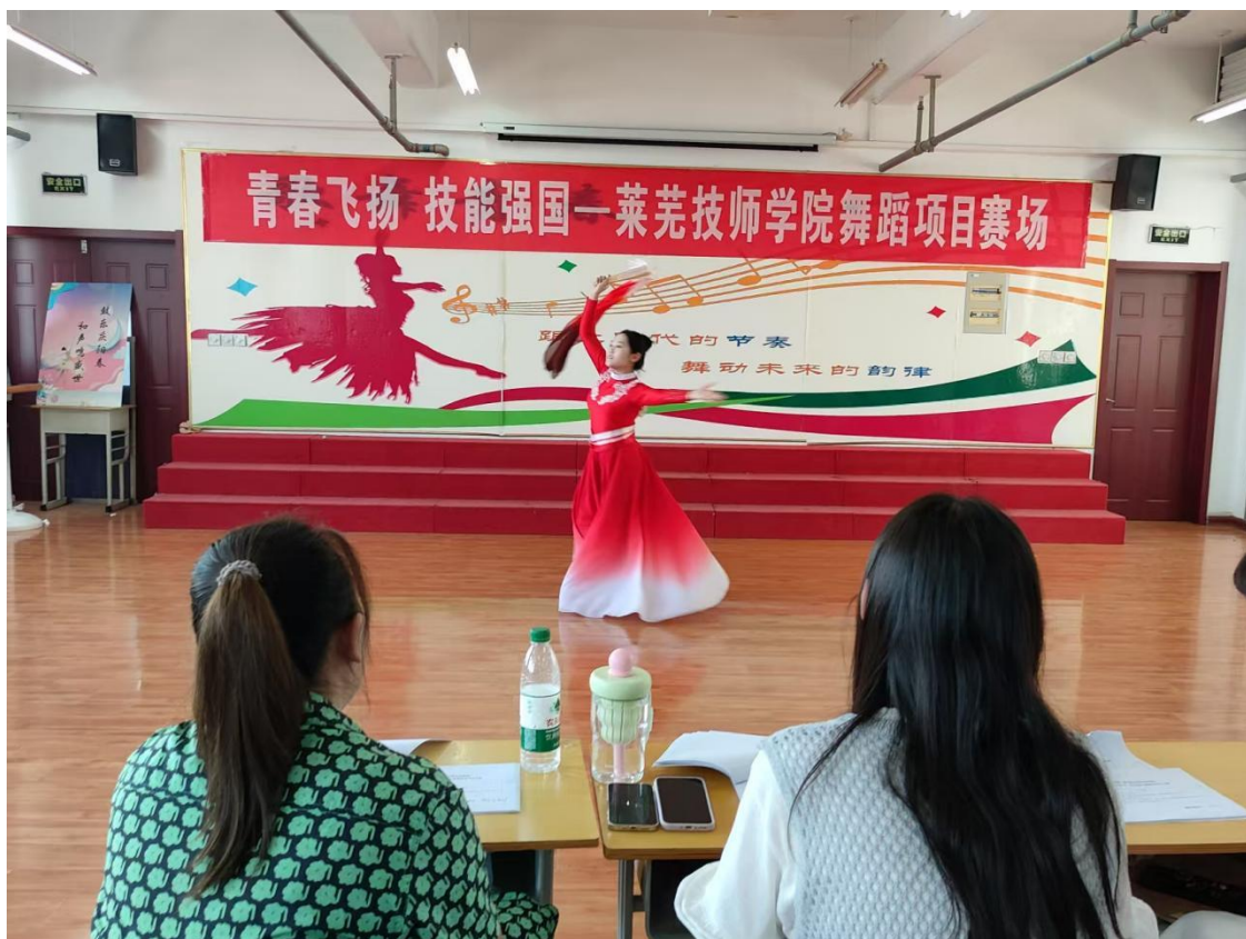
图 12 舞蹈项目竞赛现场